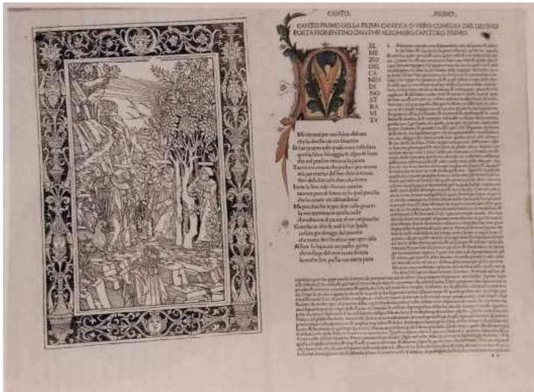
Fig. 3: DANTE ALIGHIERI, Commedia , Brescia: Bonino Bonini, 31 V 1487, cc. a1v-a2r, esemplare già appartenuto al Centro Dantesco dei Frati minori conventuali di Ravenna.