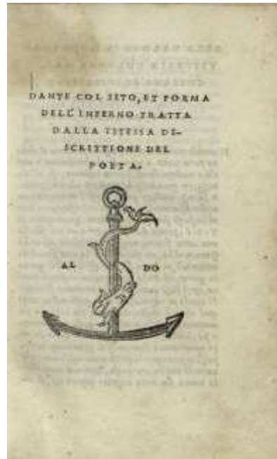
Fig. 2: DANTE ALIGHIERI, Dante col sito, et forma dell'Inferno tratta dalla istessa descrizione del poeta , Venezia, Aldo Manuzio, 1515, USB Köln: 1N18, c. r1r